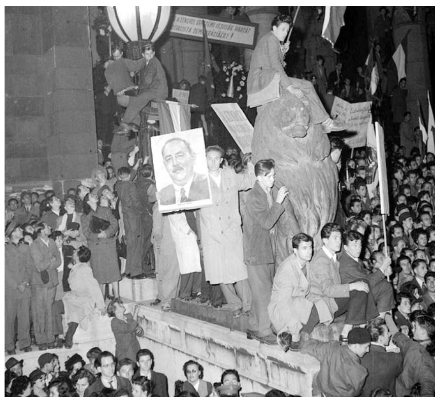
La foule révolutionnaire écoute le discours de Imre Nagy devant le parlement

La déclaration de Nagy, annonçant le retrait de la Hongrie du Pacte de Varsovie et sa neutralité, eut lieu le 1er novembre. Trois jours plus tard, l'armée soviétique lança une attaque généralisée contre la Révolution, et son écrasante supériorité de force finit par briser la résistance armée. Dans son message radiophonique, János Kádár fit état de la formation d'un gouvernement