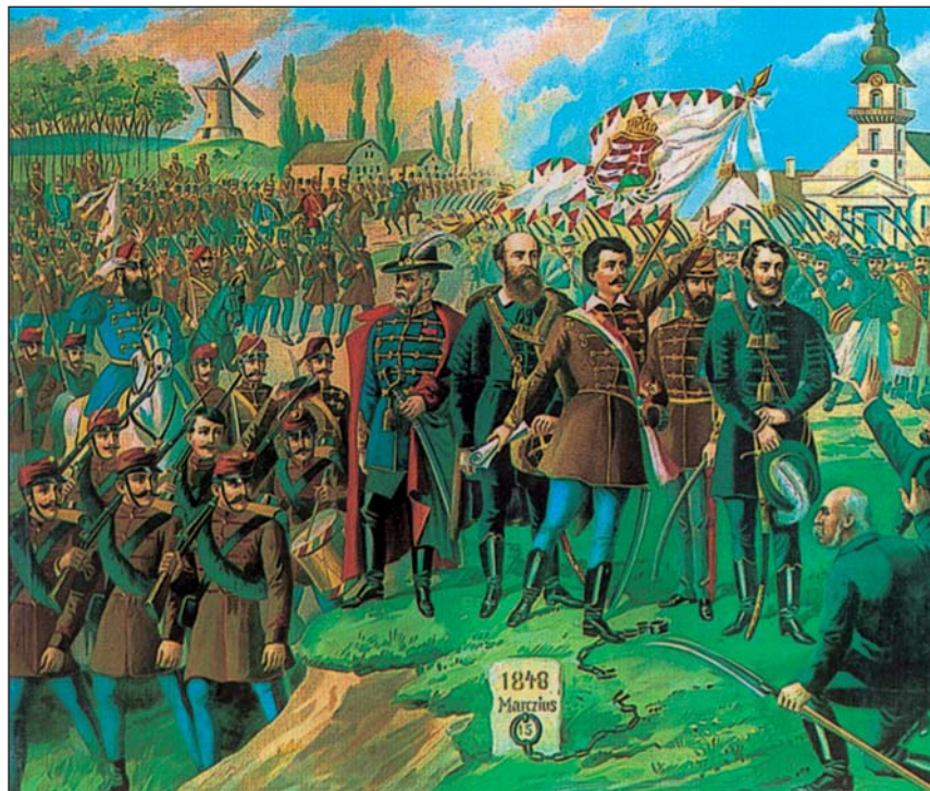
Lithographie emphatique représentant le héros de la Révolution de 1848. De gauche à droite le général Joseph Bem, le premier ministre Lajos Batthyányi, le poète Sándor Petőfi, le général George Klapka et Lajos Kossuth, la figure de proue de la Révolution.

Dans la première moitié du XIXe siècle, la Hongrie, incorporée alors à l'Empire habsbourgeois et privée d'autonomie, était l'une des régions les moins développées de l'Europe. La Cour viennoise s'opposa à toute tentative de réforme, bien que les initiateurs de la transformation sociale, issus des rangs de la noblesse nationale éclairée, ne désirassent nullement porter atteinte aux droits et aux prérogatives du monarque.