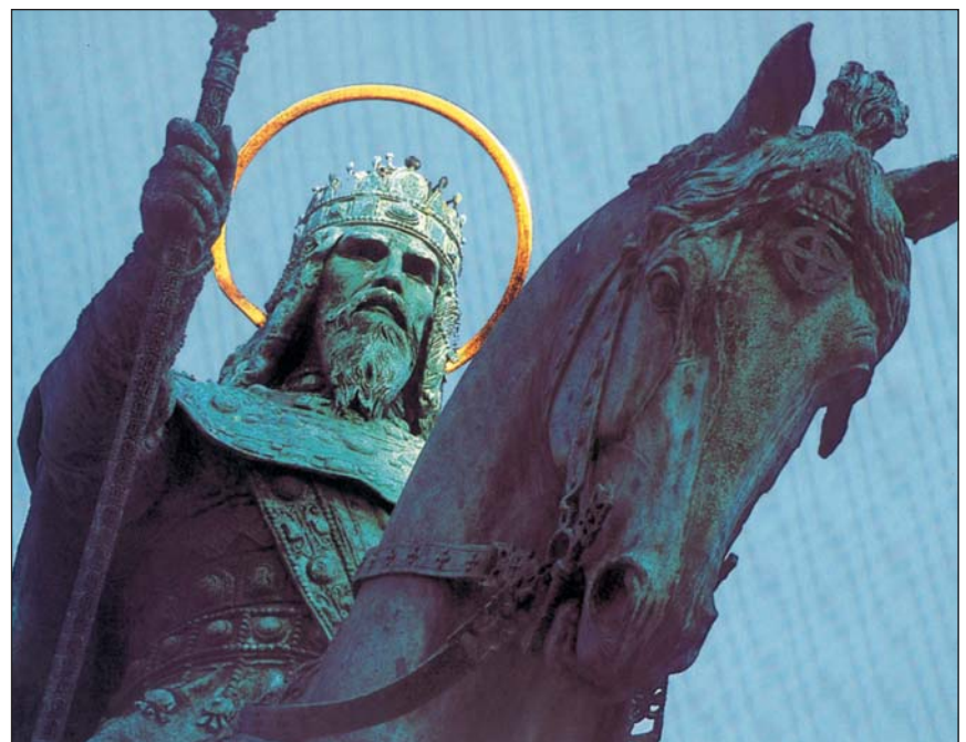
Statue du fondateur de l'Etat Saint Etienne